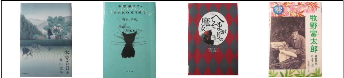
「本売る日々/青山文平著」 「不思議カフェ/村山早紀著」 「へそまがりの魔女/安東みきえ著」 「牧野富太郎/松原秀行著」